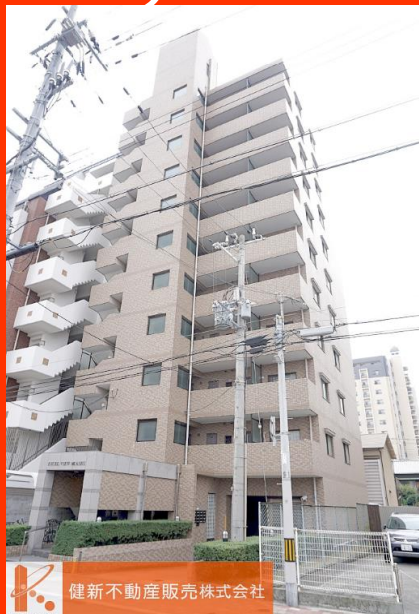
健新不動産販売株式会社