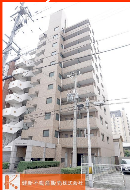
健新不動産販売株式会社